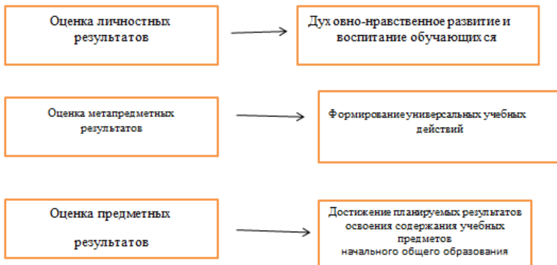
Рис. 1. Влияние системы оценки на образовательную деятельность

Система оценки как комплекс оценочных процедур мотивирует учащихся на достижение планируемых результатов различных групп, но важным условием повышения уровня мотивации к образованию в течение всей жизни, освоению умения учиться является реализация программы формирования универсальных учебных действий. Система оценки с «накопления отметок» на фиксацию достигнутых учащимися планируемых результатов, а также обеспечить формирование у учащихся универсальных учебных действий – контроля, оценки, познавательной рефлексии и смыслообразования.